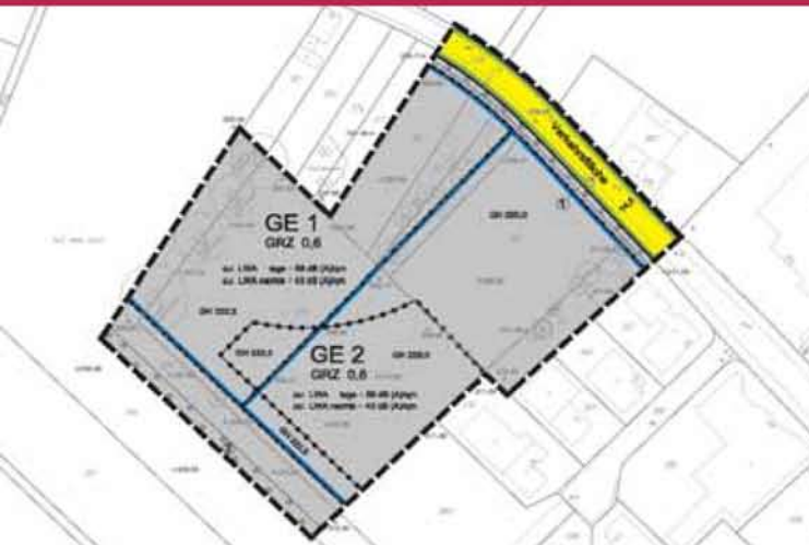
Bebauungsplan Neuenhofstraße-Süd, Aachen

Weitergehende Fachkompetenz aus den Bereichen Verkehrstechnik, Stadtplanung, Grünflächenplanung, Entwässerungsplanung wird bei Bedarf aus Fachbereichen im eigenen Haus oder extern bereitgestellt. Dazu nutzen wir ein Netzwerk von Fachplanern und Partnerbüros.