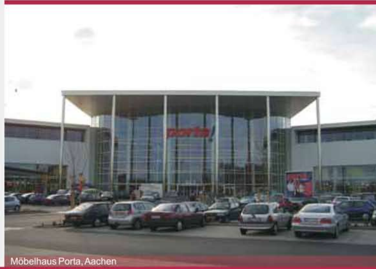
Möbelhaus Porta, Aachen

Weitere Aufgaben rund um den vorhabenbezogenen Bebauungsplan können sein: