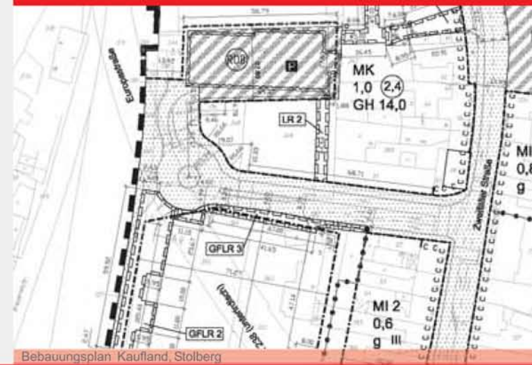
Bebauungsplan Kaufland, Stolberg