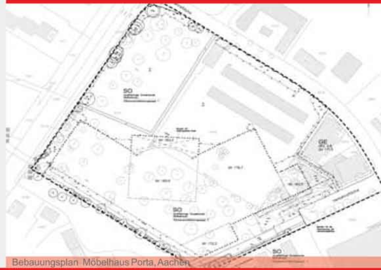
Bebauungsplan Möbelhaus Porta, Aachen

Ein rechtssicherer Bauleitplan muss unter Berücksichtigung ■ der städtebaulichen Rahmenbedingungen ■ der Anforderungen aus den übergeordneten Fachplanungen ■ der Planungsziele ■ der gestalterischen Möglichkeiten für die Planung ■ der Lage des Plangebiets und der Potentiale der Umgebung ■ der Erfordernisse aus Ver- und Entsorgungseinrichtungen ■ der Anforderungen aus umweltrelevanten Themen ■ der Wirtschaftlichkeit erarbeitet werden.