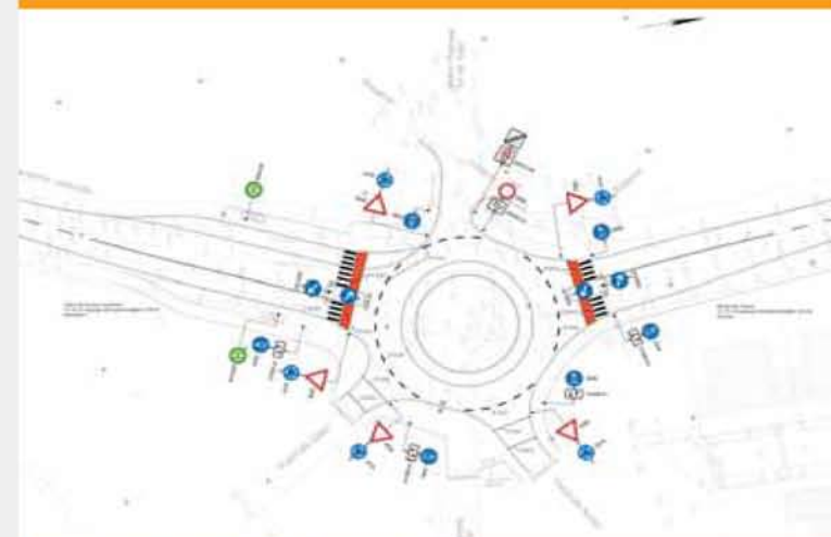
Ausführungsplanung Adrian-Meller-Straße, Köln

Wegen der Bedeutung und Komplexität muss die Planung der kommunalen Verkehrsinfrastruktur von der Idee bis zur Ausführungsreife interdisziplinär erfolgen.