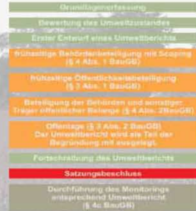
Verfahrensablauf nach BauGB